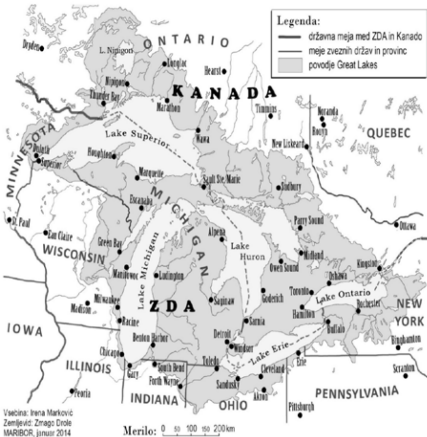
Slika 2: Območje Great Lakes, kjer je deloval misijonar in škof Irenej Friderik Baraga