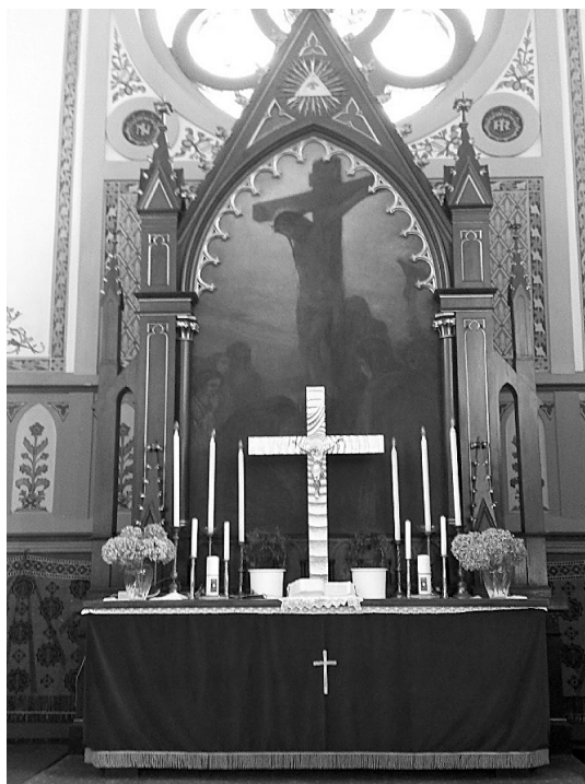
Slika 5: Zgled oltarne slike nad oltarjem v Murski Soboti. Motivika murskosoboške oltarne slike je snemanje Jezusa s križa, avtor pa Jenő Bory. To je tudi primer nikoli dokončane umetnosti, saj je avtor slike pred dokončanjem umrl – to se vidi predvsem na naslikani roki.