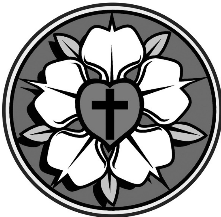
Slika 7: Lutrova roža, ki je bila primarno Lutrov pečat. Lahko se najde v različnih likovnih variacijah.

Oblikovan je tako, da se voda, s katero je otrok ali odrasla oseba krščena, steka v lijakasti del krstnega kamna, ki vodo zadrži, da pozneje odteče. Dodajmo, da nekatera druga verstva, starejša in mlajša od krščanstva, namesto krstnega kamna uporabljajo reke, jezera ali morje.