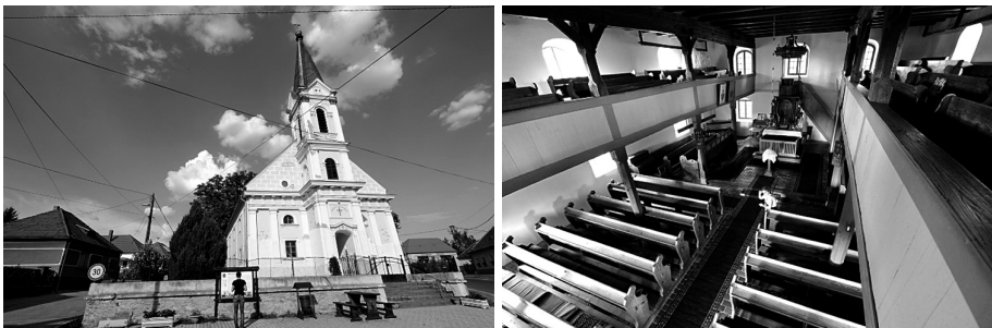
Slika 1: Zunanost (zgoraj) in notranost (spodaj) cerkve v kraju Nemescsó, ki je predvsem v notranosti še ena redkih originalno zasnovanih evangeličanskih molilnic (avtor Borut Juvanec).

Prva molilnica v Bodoncih je bila stavba, zgrajena iz lesa in krita s slamo; močno je spominjala na nekoliko večjo stanovanjsko hišo. Molilnica je bila obzidana z