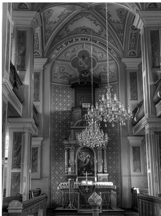
Slika 4: Zgled prižnice iz evangeličanskega sakralnega objekta v Bodoncih. Spodaj je oltar z oltarno sliko, prižnica se dviga za njim in je na višini galerije.

katerega se dostopa prek samostojnih stopnic v objektu. Takšne prižnice so pri evangeličanih najbolj pogoste, saj poudarjajo, da je božja beseda nad nami.