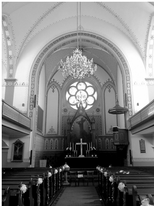
Slika 3: Zgled oltarja v evangeličanski cerkvi v Murski Soboti.

čestvo. Vendar dandanes pogosto predvsem lokacija cerkve in arhitekturna zasnova objekta opredeljujeta notranjost cerkve in s tem tudi orientiranost oltarja.