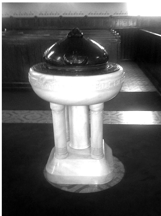
Slika 6: Krstni kamen iz cerkve v Puconcih.

ga začeli na različnih predmetih, pozneje so ga uporabljali tudi za osnovni tloris cerkva in kot znak moči in oblasti Cerkve.