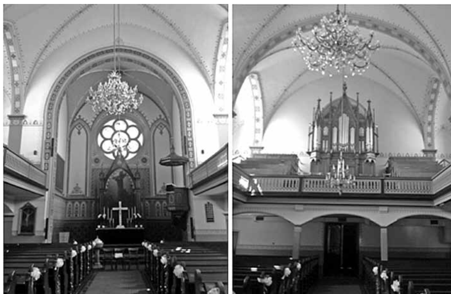
Slika 2: Notranjost cerkve Martina Lutra v Murski Soboti; fotografija: Andreja Benko.

(1909) vpeljal armirani beton kot konstrukcijski material Tákats pri obnovi evangeličanske cerkve v Puconcih. Na daljših straneh je po pet za neogotiko, ki posnema gotski stil, značilnih opornikov, ki statično definirajo objekt in ga poudarjajo. Sklepni fasadni sloj objekta je bele barve v kombinaciji z opeko, ki poudarja statične elemente: oporni stebri in okvirji odprtih so izdelani iz vidne opeke. Vzorec se nadaljuje tudi pri zvoniku, kombinacija opeke z ometom se kaže z vokalno nastavitvijo opeke, to pa optično zviša zvonik.