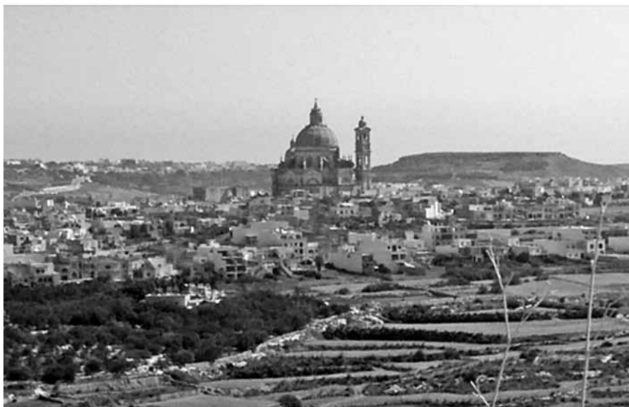
Slika 4: Panoramski pogled na mesto Xewkija.

naraslo za več kakor sedemkrat. Objekti so se v času, ko so bili zgrajeni, uporabljali le za bogoslužje posamezne vere. Šele skozi čas se je izoblikovala njihova večnamenskost in v današnjem času se tako evangeličanska kakor katoliška cerkev zaradi dobre akustike uporabljata tudi kot prireditveni prostor za raznovrstne akustične koncerte.