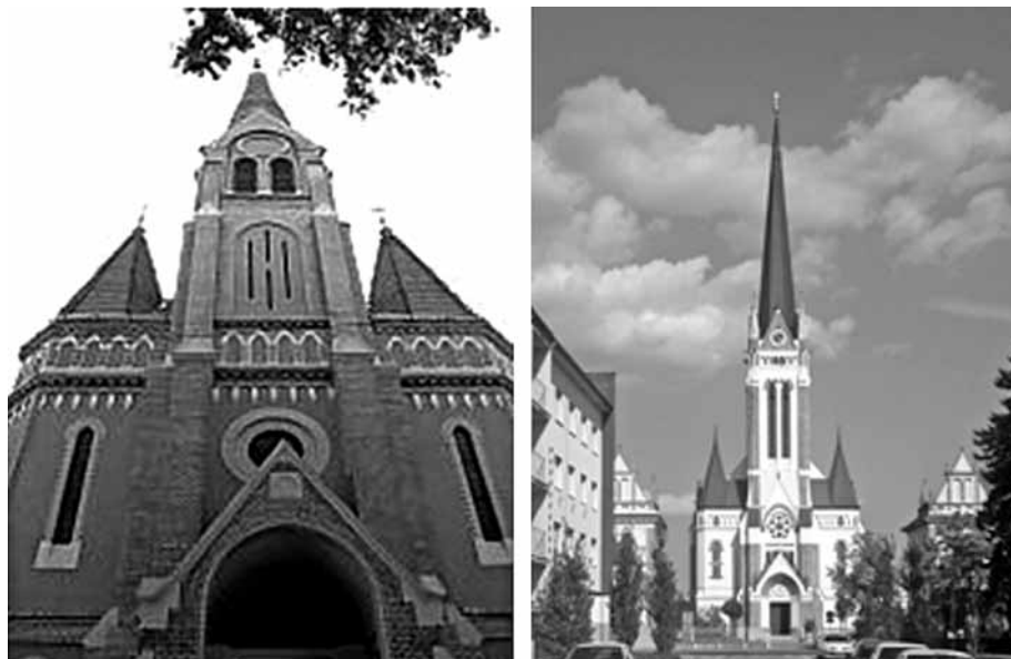
Slika 1: Evangeličanski cerkvi v Oradei (vir: http://www.welcometoromania.ro/Oradea ) in v Murški Soboti; fotografija: Andreja Benko.

nekaj vernikov in jim naznanil, da jim zemljišče prepusti po nabavni ceni 11.000,00 forintov. To je prostor, kjer danes stoji neogotski kompleks evangeličanske cerkve s pripadajočimi objekti (Hari 2000). Nekateri viri pričajo: pozicija in zasnova evangeličanskega kompleksa sta takšni, da se skozi ključavnico vrat glavnega vhoda v grad vidi celotna cerkev, kakor je razvidno s slike 2. Od tistega časa dalje naj bi grofje uporabljali za vhod v grad le stranski vhod s severne strani, glavni vhod s ploščadi pa naj bi bil zaklenjen.