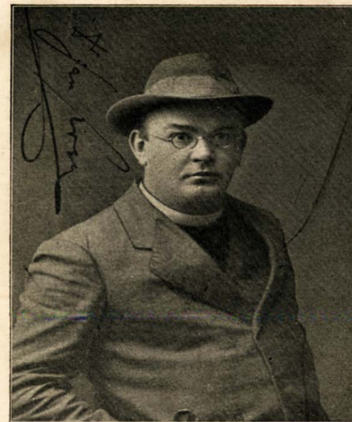
† Dr. Jan. Ev. Krek