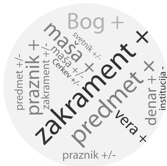
Slika 3: Pasivni vernik in potrošnik (2)

kev voditeljica, energija in praviloma močno navzoča. Cerkev kot tema pogovora je »pogosta« v družini in »pogosta« med prijatelji. Anketiranci tega tipa so »visoko« zaznamovani z altruističnimi vrednotami.