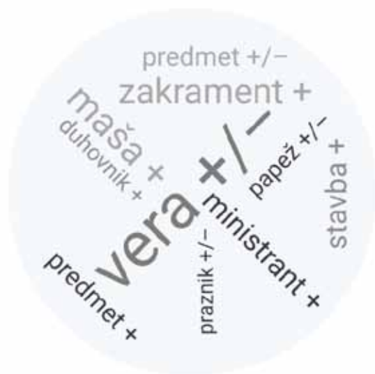
Slika 4: Molčečnej in materialist (3)

pa štiri nevtralne (vera, predmet, papež, praznik). Njihova ravnodušnost se torej pokaže v odnosu do verskih vsebin, do nekaterih predmetov, do hierarhije in do katoliških praznikov. Pozitivne besede uporabljajo za tiste stvari, za katere se osebno zanimajo: zakramenti, predmeti, maša, duhovnik in svetišče.