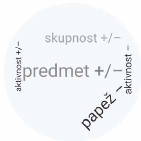
Slika 6: Anonimni vernik in ravnodušnež (5)

Za to skupino je značilno, da o sebi ne želijo povedati nobene informacije, saj izpustijo celoten del vprašalnika, ki zadeva socialno-demografske lastnosti.