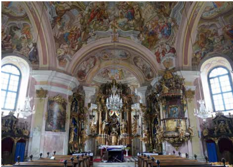
Slika 7: Marijina romarska cerkev na Sladki Gori, pogled proti prezbiteriju.

velikost slike, ki povsem pristaja med pilastra – s tem pa je dokazana tudi teza, da je to mesto njena prvotna lokacija.