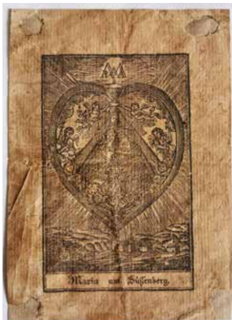
Slika 1: Romarska podobica Sladke Gore. 7