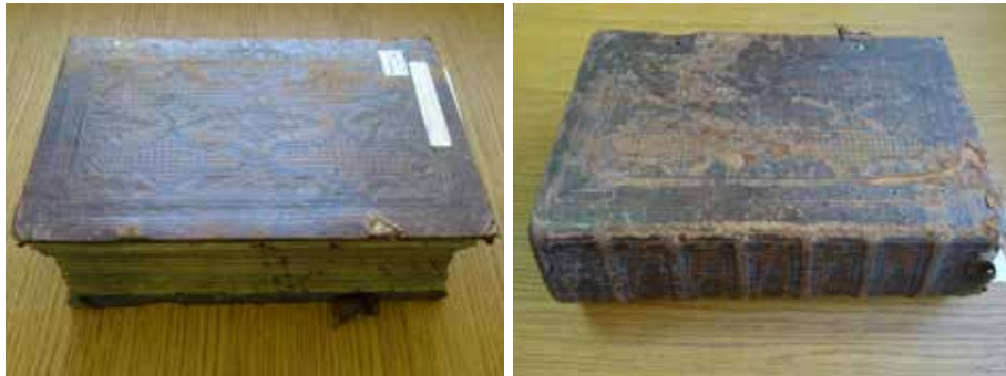
Slika 5: Popis članov sladkogorske kongregacije Marijinega brezmadežnega spočetja.

za vpis duhovnika. V knjigi ni podatkov o morebitnih izstopih članov, ob vsakem zaključku leta pa je zapisano število vpisov za tekoče leto. 29 Pred začetkom vpisovanja članov leta 1791 je pisec zapisal nagovor z nekaj besedami o čaščenju Marije. Nato sledi krajši popis, ki je ločen po spolu. Kongregacija je bila v obdobju popisa odprta tudi za ženske; slednje je bilo od leta 1751 uradno omogočeno z odlokom papeža Benedikta XIV. (146). Knjiga nima paginacije, kar obdelovanje tako obsežnega popisa nekoliko otežuje. Na koncu popisa sledi kar nekaj praznih lističev, ki niso bili uporabljeni (zaradi morebitnega prenehanja delovanja družbe). Knjiga je vezana v rjavo usnje, ki je na platnicah potiskano z reliefnimi geometrijskimi vzorci in rastlinsko ornamentiko. Notranje strani platnic so obarvane vijolično in okrašene z ornamentalnim vzorcem. Znotraj popisa ni zaslediti ilustracij.