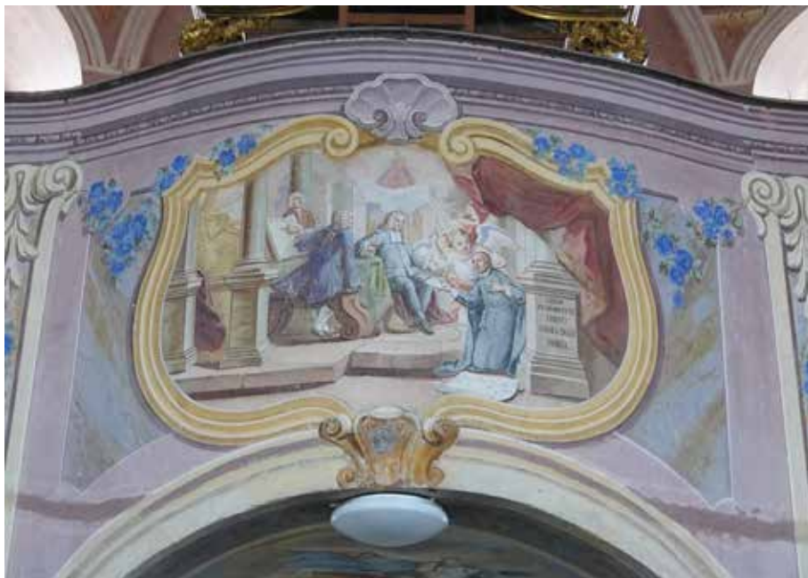
Slika 2: Freskantska poslikava na korni balustradi, kjer naj bi bil upodobljen Janez Mikec.