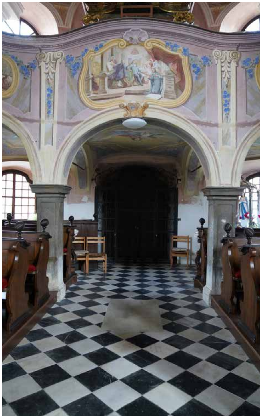
Slika 3: Poslikava in grob Janeza Krstnika Mikca.